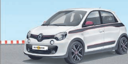
RENAULT TWINGO HIGHLIGHT SCE 70 ECO 2