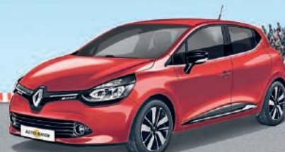
RENAULT CLIO HIGHLIGHT 1.2 16V 65

Fahrzeugpreis* 10.076,- € INKL: ÜBERFÜHRUNG UND BEREITSTELLUNG, inkl. Flex Plus Paket** im Wert von 440,- €. Bei Finanzierung: Nach Anzahlung von 1.560,- €, Nettodarlehensbetrag 8.516,- €, 60 Monate Laufzeit (59 Raten à 79,- € und eine Schlussrate: 3.855,- €), Gesamtlieferleistung 50.000 km, eff. Jahreszins 0,00 %, Sollzinssatz (gebunden) 0,00 %, Gesamtbetrag der Raten 8.516,- €. Gesamtbetrag inkl. Anzahlung 10.076,- €.