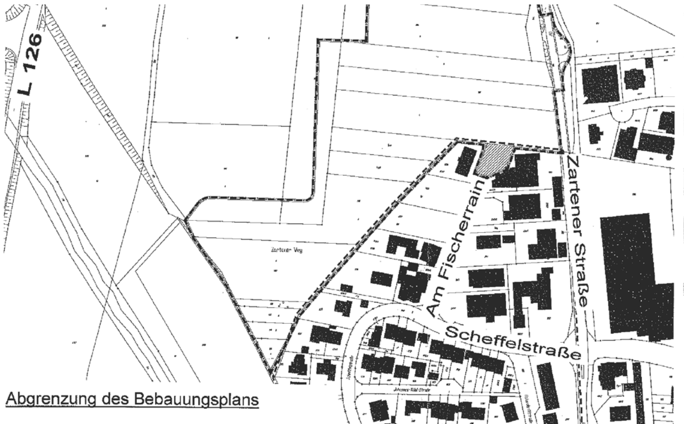
Abgrenzung des Bebauungsplans