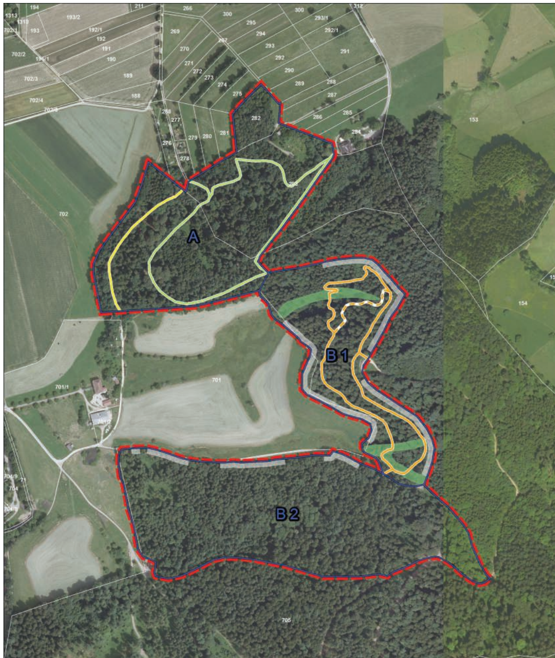
Erholungswaldsatzung Kirchzarten - Übersichtskarte

Der Geltungsbereich der Erholungswaldsatzung ergibt sich aus der Übersichtskarte nach § 2 Abs. 3 Satz 1 Erholungswaldsatzung, die im folgenden Kartenausschnitt dargestellt ist: