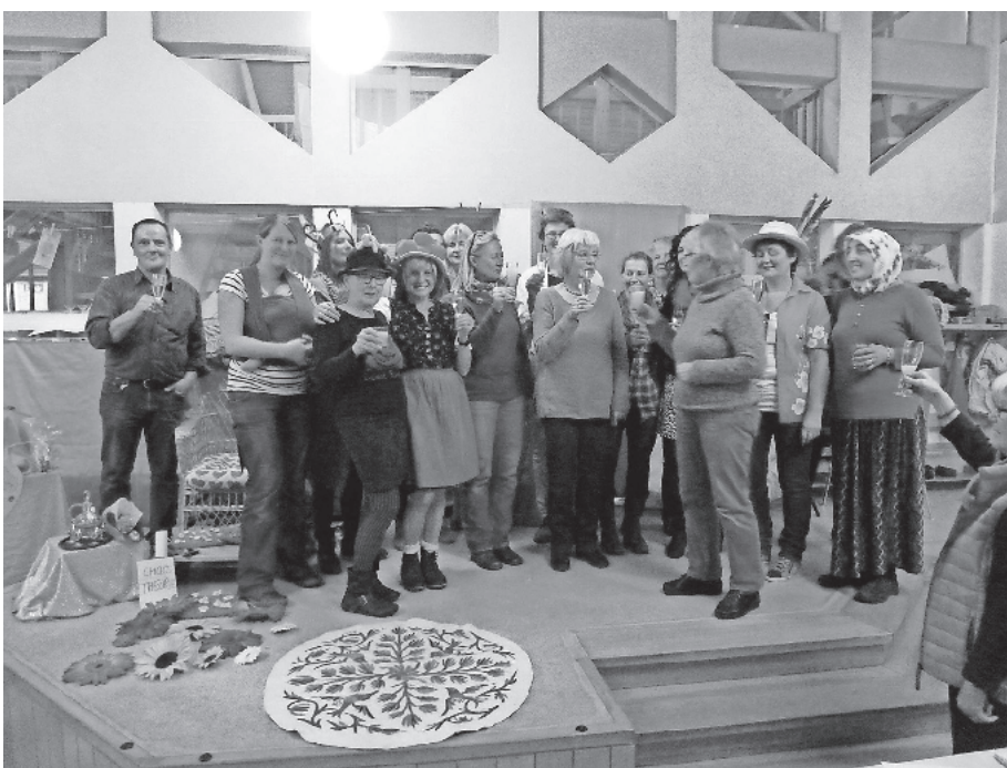
Das Bild zeigt die Verabschiedung im Kindergarten Zarten

Das Landratsamt Breisgau-Hochschwarzwald bleibt an Heiligabend und Silvester für Besucher ganztags geschlossen. Dies gilt für die Verwaltungsgebäude und Kreiseinrichtungen an allen Standorten im Landkreis. Die Tiefgarage in der Stadtstraße 2 in Freiburg ist an Heiligabend, Silvester und an Sonn- und Feiertagen ebenfalls geschlossen.