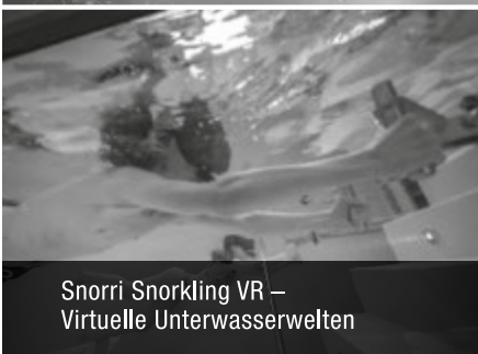
Snorri Snorkling VR – Virtuelle Unterwasserwelten