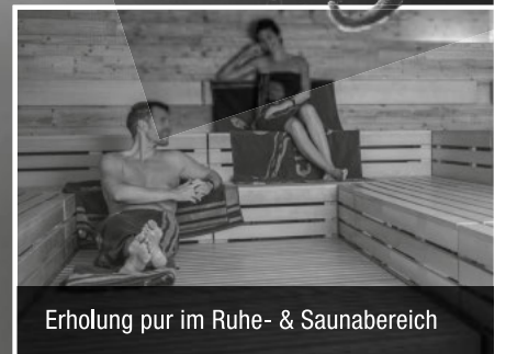
Erholung pur im Ruhe- & Saunabereich