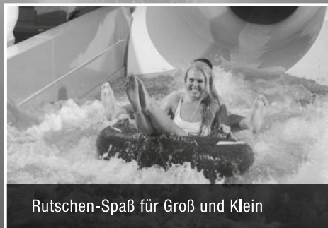
Rutschen-Spaß für Groß und Klein