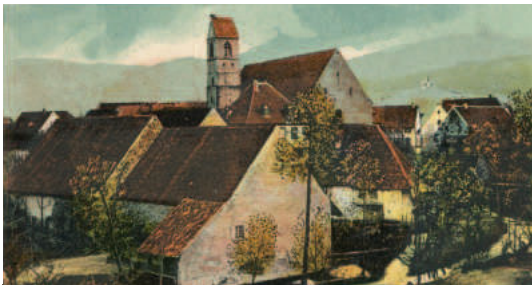
Talvogelnscheunen um 1904