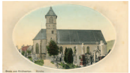
Postkarten aus der Sammlung Axel Steinhart