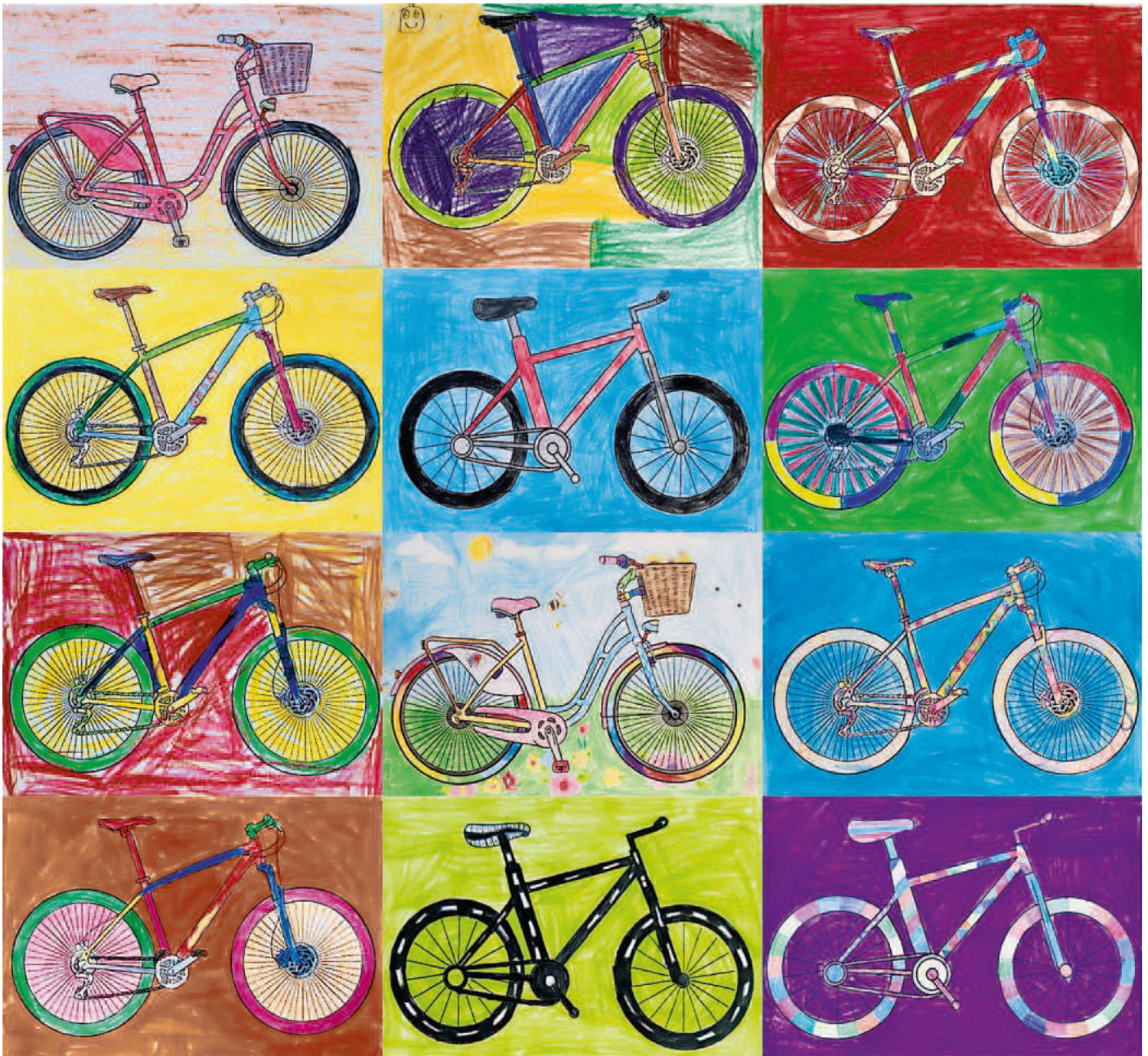
Gemalt von Kindern aus den Kirchzartener Grundschulen