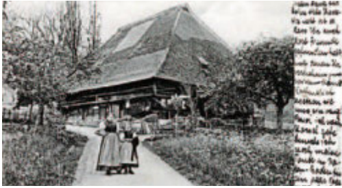
Fußstall in Dietenbach, um 1905