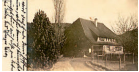
Postkarten aus der Sammlung Axel Steinhart