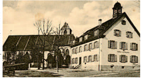
Postkarte aus der Sammlung Axel Steinbart