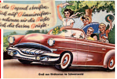
Postkarte aus der Sammlung Axel Steinhart