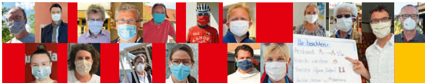
„Kirchzarten trägt Masken!“