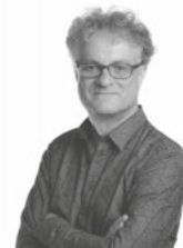
© Karlheinz Ruhstorfer Prof. Dr. Karlheinz Ruhstorfer, Albert-Ludwigs-Universität Freiburg

Welchen Sinn hat das „Katholische“ an der Schwelle zu globaler Identität?