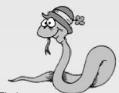
Schlange - Zisch