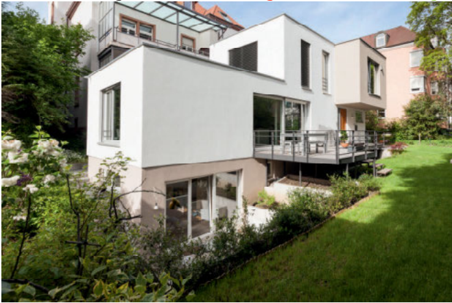
Schlüsselfertiges GrünspechtHaus in FR- Herdern

1984-2018 Über 30 Jahre Holzbauerfahrung